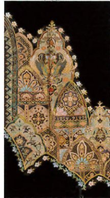
B119 レンタル価格 ¥80,000