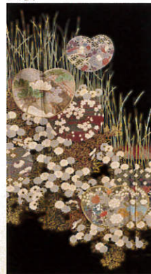
B118 レンタル価格 ¥60,000