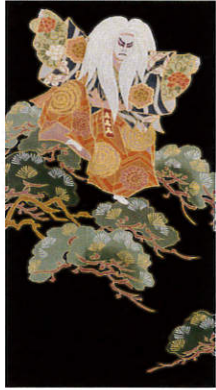
C314 レンタル価格 ¥100,000