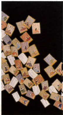
B309 レンタル価格 ¥80,000