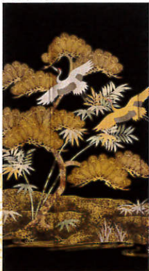
B109 レンタル価格 ¥60,000