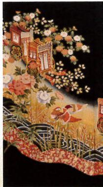
源氏車とおしどり