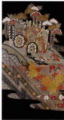
源氏車かざら帯文