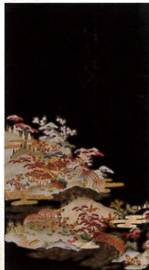
A209 レンタル価格 ¥40,000