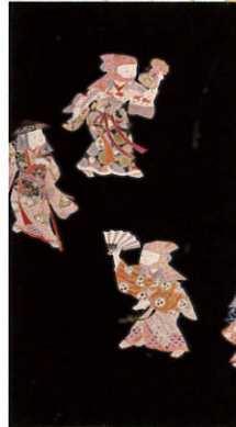
B208 レンタル価格 ¥60,000