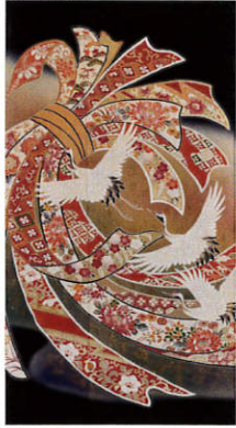
B313 レンタル価格 ¥60,000