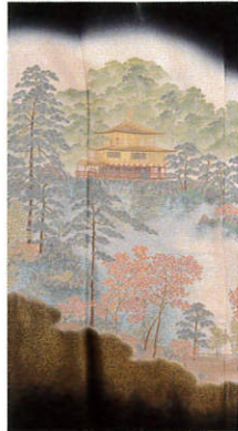
C122 レンタル価格 ¥100,000