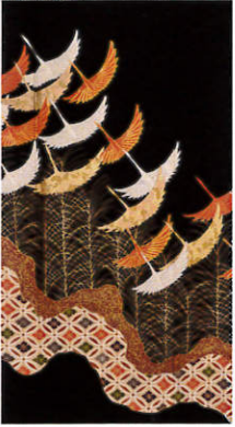
B222 レンタル価格 ¥60,000