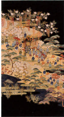
B111 レンタル価格 ¥60,000