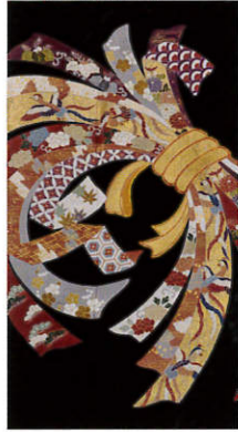
C316 レンタル価格 ¥100,000