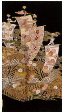
A223 レンタル価格 ¥50,000