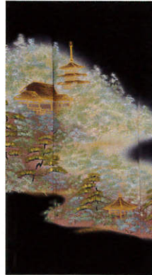
C113 レンタル価格 ¥60,000